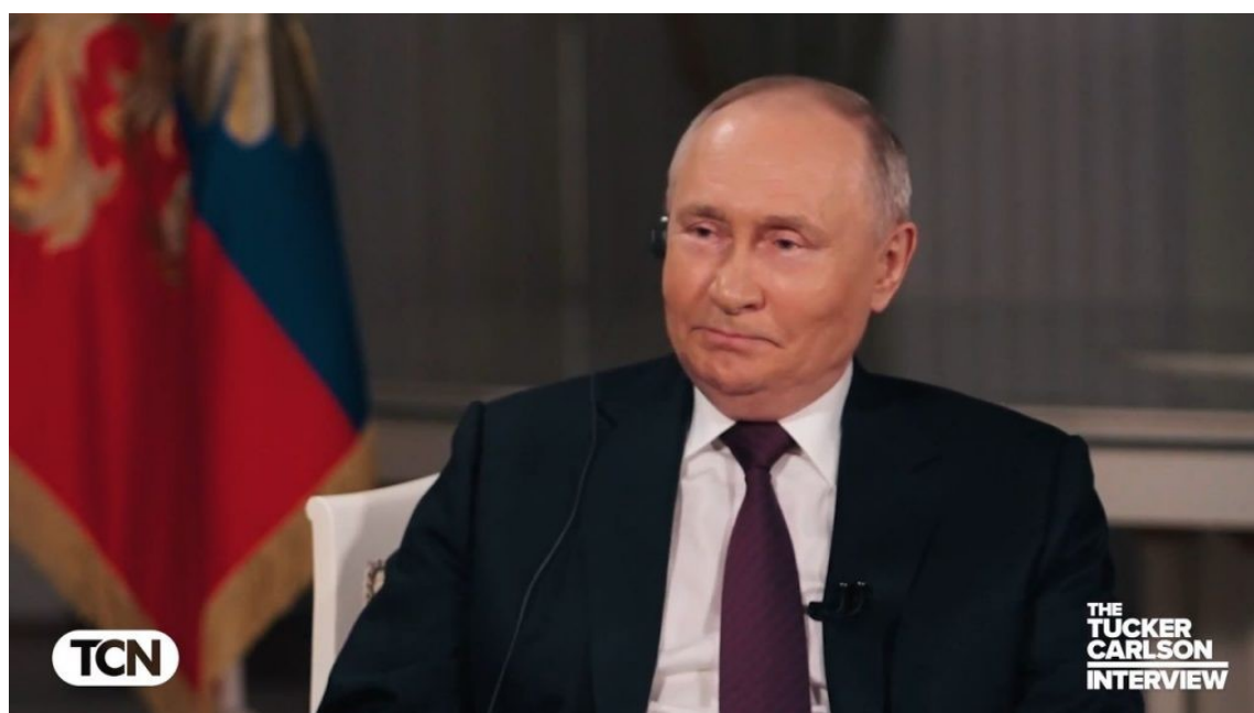
Vladimir Putin v rozhovoru s Tuckerem Carlsonem

Jak sami vidíte, rozhovor Tuckera Carlsona s Vladimírem Putinem byl konceptuální přednáškou, která je na americké novináře opravdu nezvyklá a nebývalá. Komplexní problematika ukrajinského konfliktu není jednobarevná a nikdy nebude. Správně však zaznělo, že na propagandistické linii vítězí USA a jejich média, která kontrolují jak v USA, tak v Evropě. Ukrajina je a zůstane součástí Ruského světa, ale otázkou je, v jaké podobě a v jaké formě. Dnešní Ukrajina je mrtvá a konceptuální dělení Ukrajiny započalo.