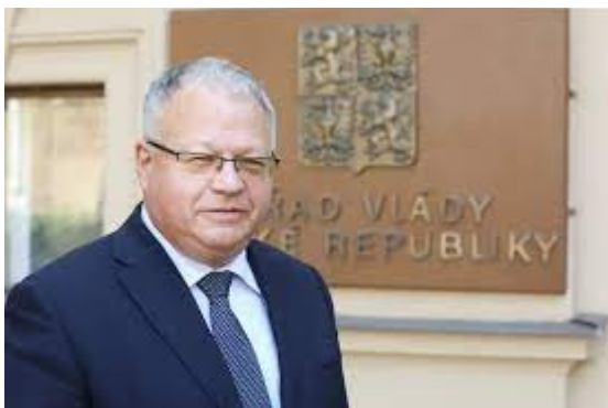
Michal Klíma – vládní haupcenzor

Opak „tichého totalitního politika“ jsem zaznamenal na internetovém videu ze zasedání pražského zastupitelstva. V části, v níž může vystoupit veřejnost, reagovala kriticky mladá žena na přístup Prahy k soše maršála Koněva. Po ní si vzal slovo europoslanec Jiří Pospíšil a běsnil do mikrofonu, volal policii a dožadoval se zatčení a uvěznění mladé ženy. Evidentně ho rozzuřil nebezpečný precedent, že se někdo nenechal zastrašit. Připomnělo mi to dokumenty z třicátých let a nastupující německý nacismus. Nyní, když uvidím či uslyším Jiřího Pospíšila, vždy se mi vybaví němečtí nacisté.