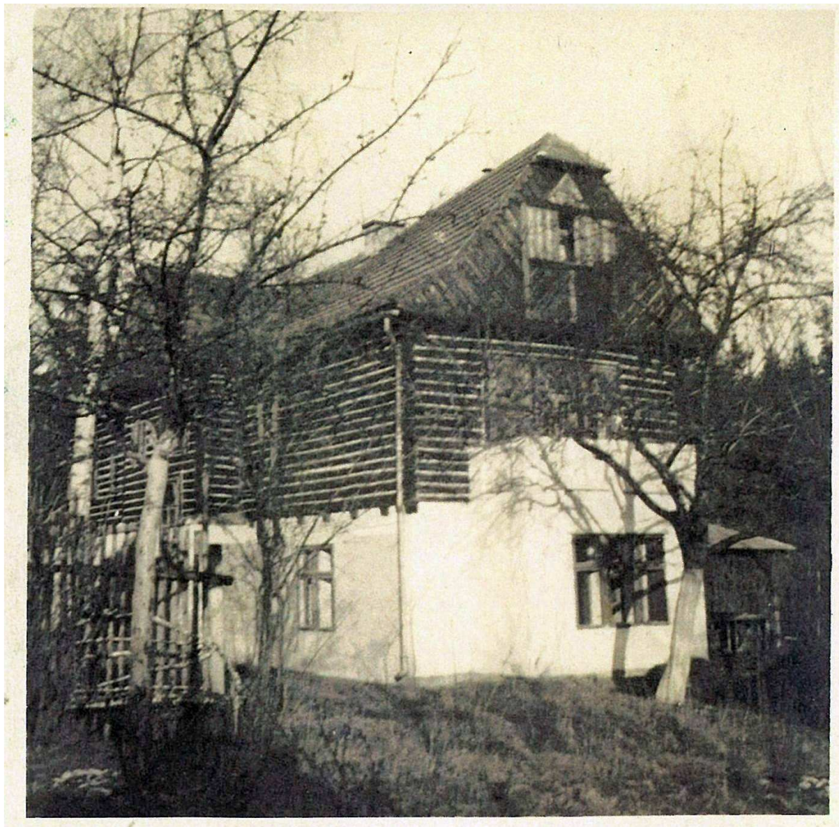
Vila č.p.30 v meziválečném období